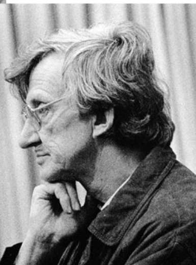
Ton de Leeuw (1926 - 1996)