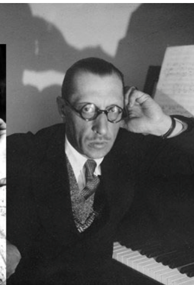
Igor Strawinsky (1882 - 1972)