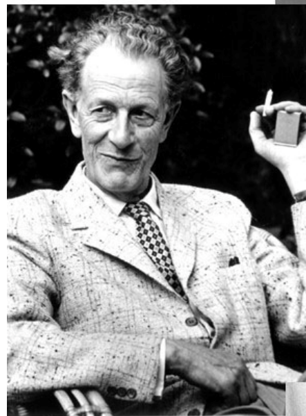
Frank Martin (1890 - 1974)